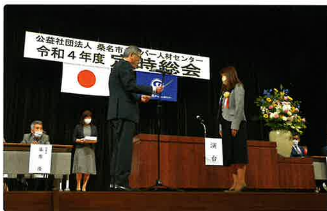
感謝状を受けられたアベテック様