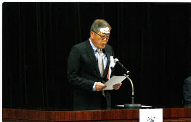
青山副理事長挨拶