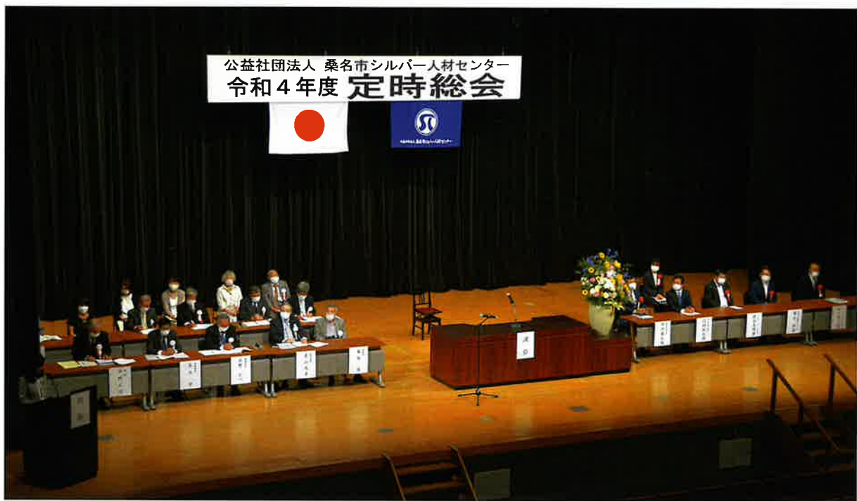
定時総会会場風景